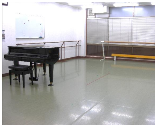
ファミリースタジオ第2