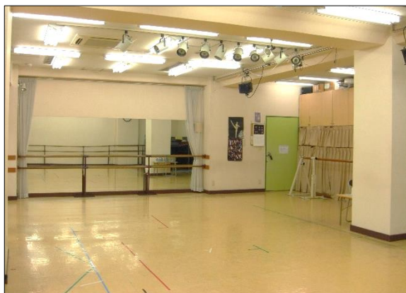
ファミリースタジオ第1