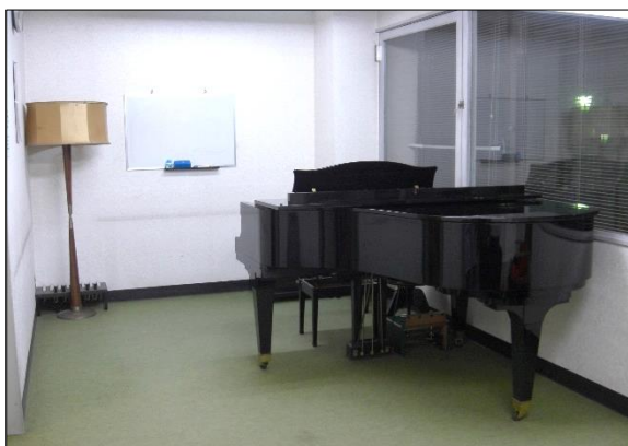
レッスンスタジオ5