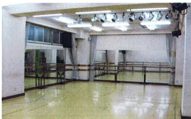
ファミリースタジオ 第1