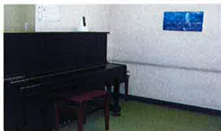
レッスンスタジオ第1-4