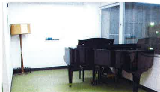
レッスンスタジオ 第5