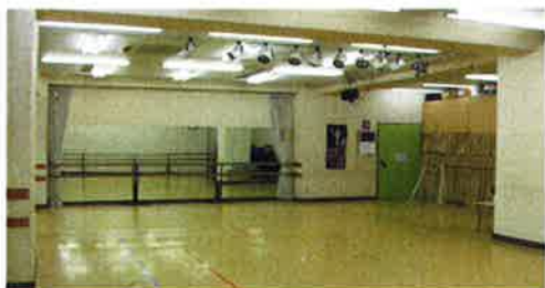
ファミリースタジオ 第1