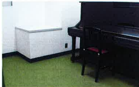
レッスンスタジオ第6-8