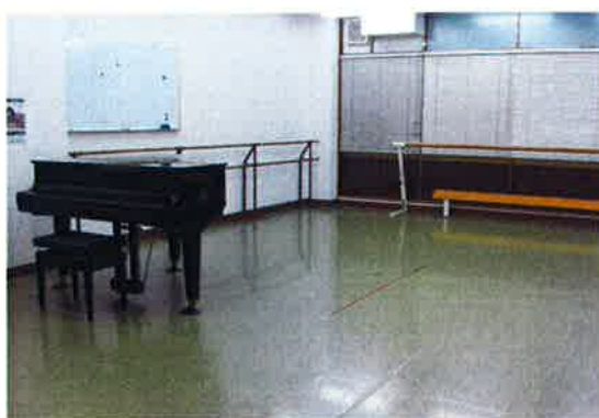
ファミリースタジオ 第2