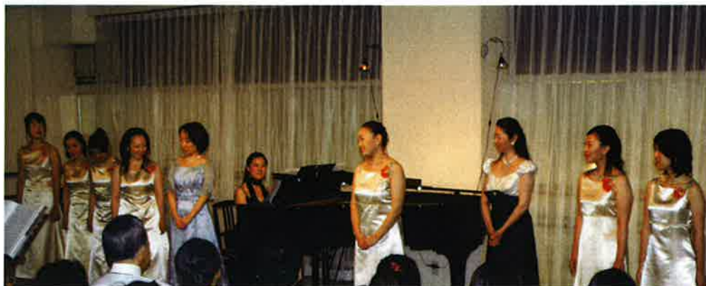
ファミリースタジオ第1のコンサート風景