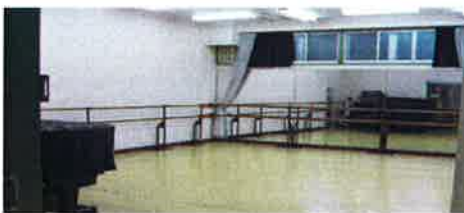
ファミリースタジオ第1