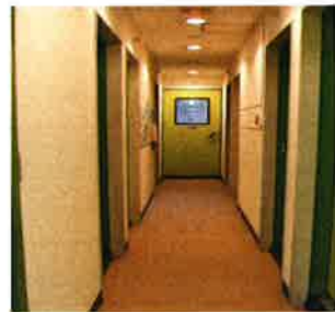
レッスンスタジオ廊下